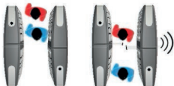
Al intentar pasar 2 personas la alerta se activa