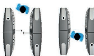
Cerrado de manera normal