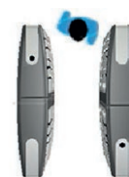
Abierto de manera normal