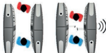
Al intentar pasar del lado incorrecto la alerta se activa