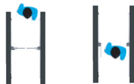
Cerrado de manera normal